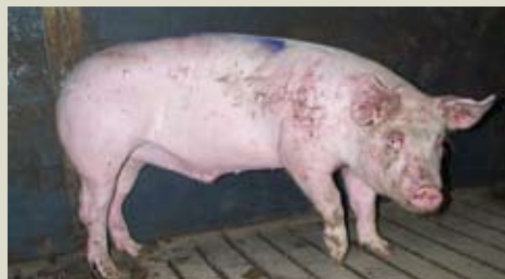
Животных, которые были в драках