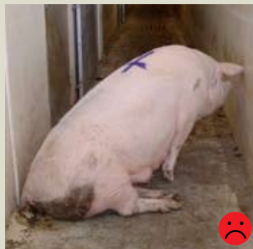
Дислокация (занос) ног. Оценка: Не пригодная для перевозки.