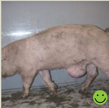
Убойная свинья с пупочной грыжей. Грыжа меньше, чем 15 см, без ран/поражений и общее состояние животного считается нормальным. Оценка: Пригодная для перевозки.