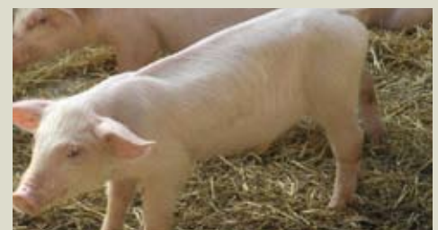
Животных, выдающих признаки неблагополучия