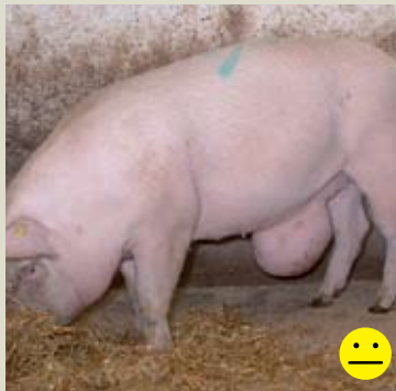
Убойная свинья с паховой грыжей. Грыжа крупнее 15 см, без язв/поражений и общее состояние животное считается нормальным. Оценка: условная пригодность для перевозки.