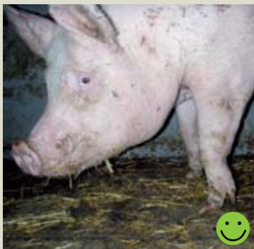
Кривые передние ноги (ноги-ходули) без артрита или других осложнений. Оценка: Пригодная для перевозки.

4. Имеют повреждения ног и копыт (хромовые свиньи): Если животное неровно стоит на всех четырех ногах, и его походка аномальная. Оторванные копыта/раны рудиментарных копыт не допускаются. Копыта не должны быть деформированными/длинными.