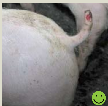
Рана поверхностная и исключительно на коже. Оценка: Пригодная для перевозки.