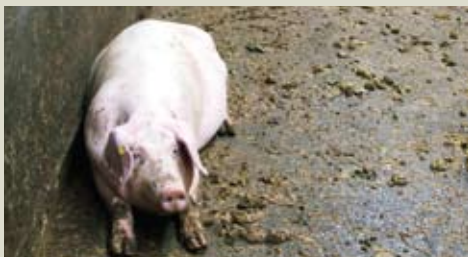
Животных, которые много сидят или лежат