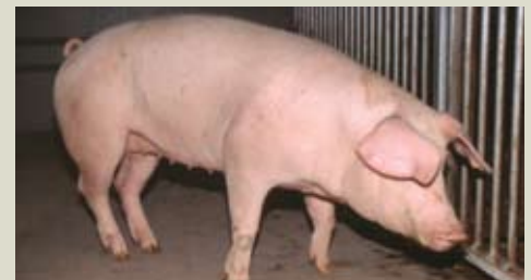
Животных с больными и вялыми ногами