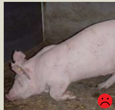
Хромые передние ноги. Оценка: Не пригодная для перевозки.

5. Супоросность: Свиноматок и проверяемые свиноматки не пригодны для перевозки в последние 11 дней периода супоросности и в первую неделю после опороса. (Правила перевозки животных, Приложение 1, часть 1, подпункт 2, параграф а)