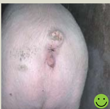
Большая часть хвоста отрезана, рана сухая и зажившая. Оценка: Пригодная для перевозки.