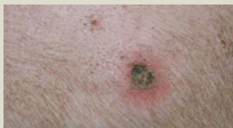
Животные с ранами на лопатках