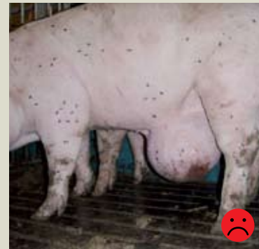
Убойная свинья с паховой грыжей. Грыжа крупнее 15 см и с большой язвой. Оценка: Не пригодная для перевозки.

4. Имеют повреждения ног и копыт (хромовые свиньи): Если животное неровно стоит на всех четырех ногах, и его походка аномальная. Оторванные копыта/раны рудиментарных копыт не допускаются. Копыта не должны быть деформированными/длинными.