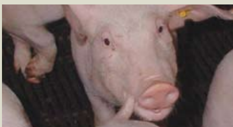
Животных с укусами хвостов или животных, которые кусаются